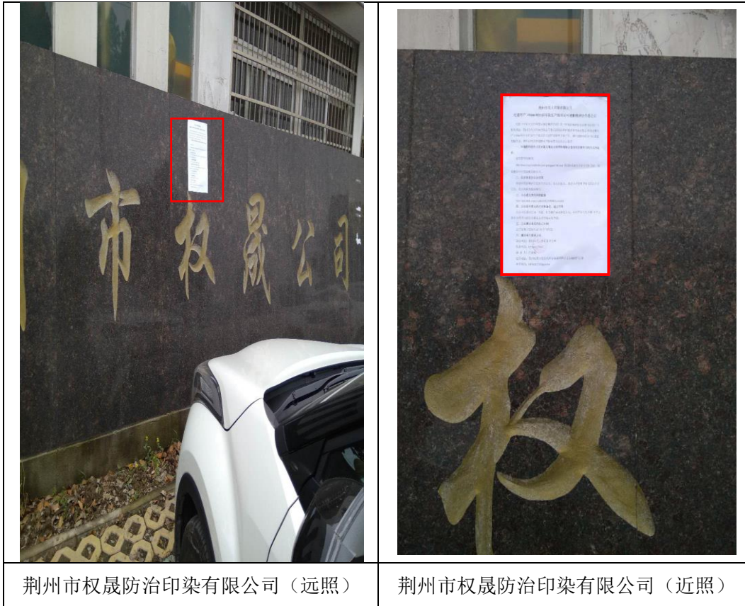
荆州市权晟防治印染有限公司（远照）