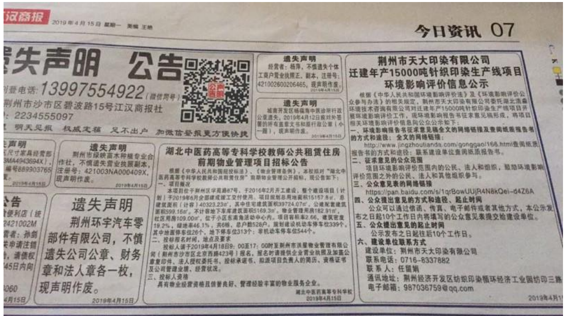
图 4 2019 年 4 月 15 日江汉商报公示