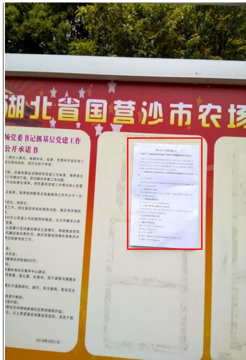
湖北省国营沙市农场党务公开栏（近照）