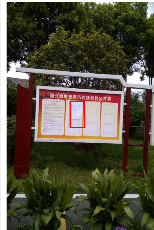
湖北省国营沙市农场党务公开栏（远照）