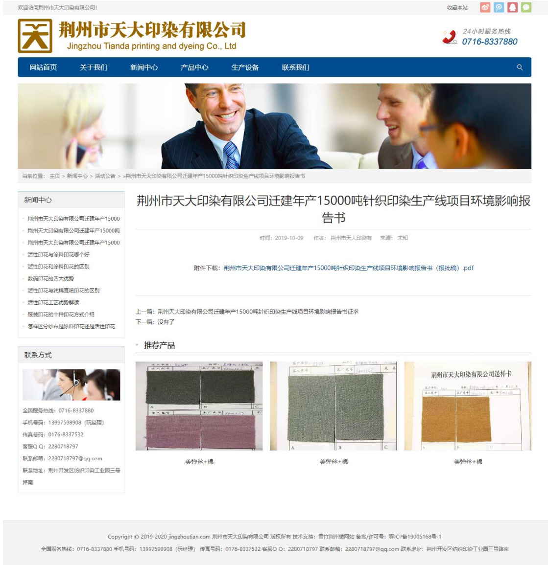
图 6 拟报批的环境影响报告书公示截图